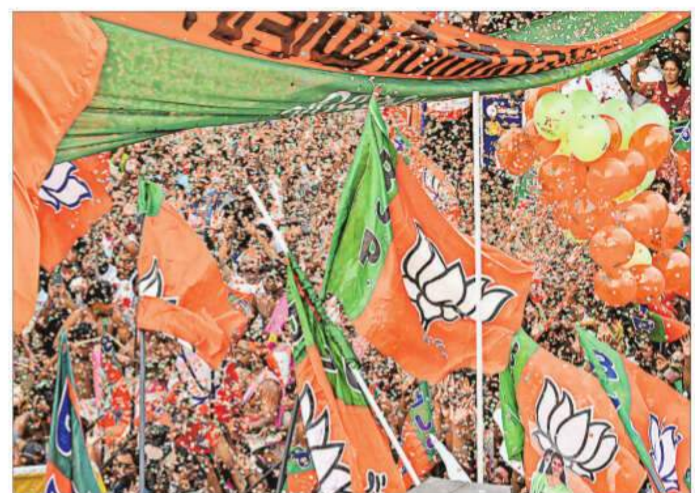
BJP supporters gather on the final day of campaigning for the Kerala Assembly elections, in Thiruvananthapuram on Tuesday